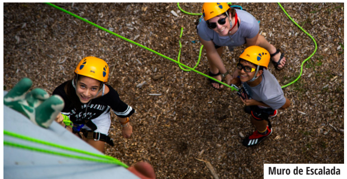
Muro de Escalada