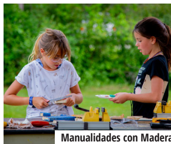
Manualidades con Madera