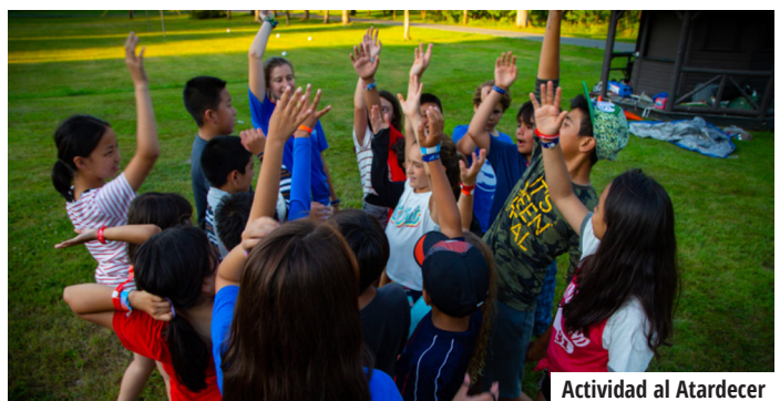
Actividad al Atardecer