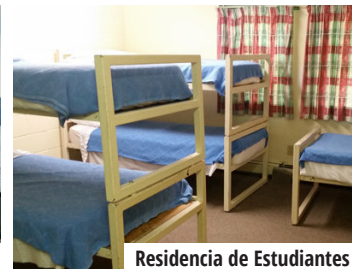
Residencia de Estudiantes