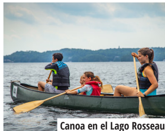
Canoa en el Lago Rosseau